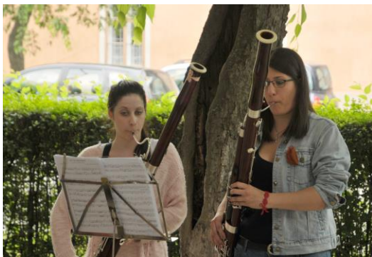
A képen a fagottosok, az „utcazenészek”